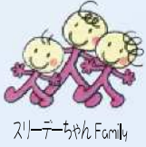
スリーデーちゃん Family